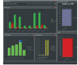
Dashboard: Alle KPIs auf einen Blick.