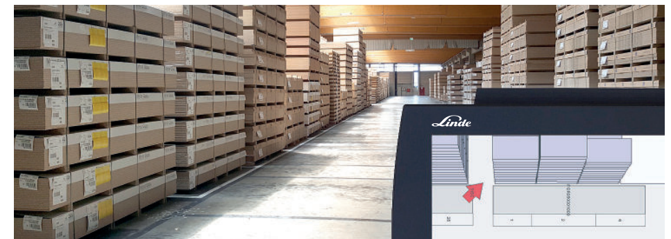
Das Staplerleitsystem navigiert den Fahrer auf dem schnellsten Weg zum Ziel.